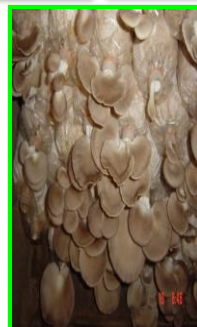
ດອກເຫັດນາງຟ້າ

ຜົນຜະລິດ ແລະ ການຕະຫຼາດ ຜົນຜະລິດທັງໝົດປະມານ 450 -500 ກິໂລ/ປີ ຈຳໜ່າຍ ຢູ່ພາຍໃນ, ອ້ອມຂ້າງວິທະຍາໄລ ແລະ ຕະຫຼາດໃນຕົວເມືອງ