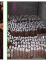
ເຕັກນິກການເຮັດຫົວເຊື້ອແລະບູກເຫັດໃນຖົງຢາງ