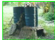
ວັດສະດຸອຸປະກອນໃນການຜະລິດເຫັດ